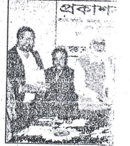
যশোর জেলা আইনজীবী সমিতির বিশেষ সংখ্যা 'বিদ্রোহী'র প্রকাশনা

রাজগঞ্জ (যশোর) প্রতিনিধি ॥ বৃহস্পতিবার গভীর রাতে রাজগঞ্জ ডিগ্রি কলেজে চুরি সংঘটিত হয়েছে। একটি সংঘবদ্ধ চোর চক্র কৌশলে অফিস ভবনের পিছনের জানালা ভেঙ্গে অফিস কক্ষে ও অধ্যক্ষের কক্ষে প্রবেশ করে ৪ টি আলমারী, ভেঙ্গে তহনহ করে নগদ ১৫শ টাকা ১টি ল্যাপটপ, (৩-এর পৃঃ ১-এর কঃ দেখুন)